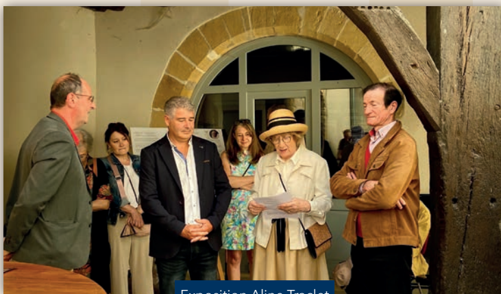
Exposition Aline Traclet