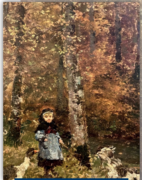
Armand Charnay, La Gardienne d'oies - Musée de Charlieu