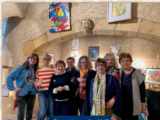
Exposition atelier MJC