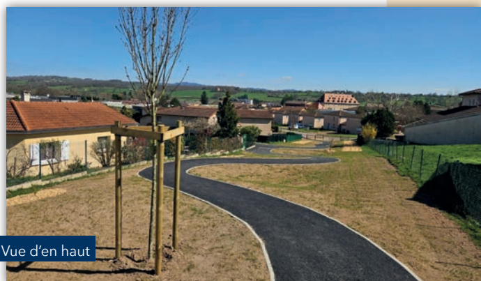
Vue d'en haut