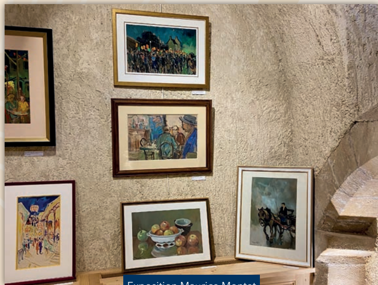
Exposition Maurice Montet

La saison ne fait que commencer. Entrée libre, curiosité bienvenue !