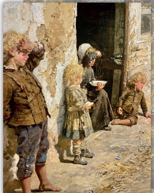
Firmin-Girard, Visite de la Chaumière - Détail, Collection particulière