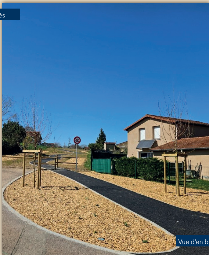
Vue d'en bas