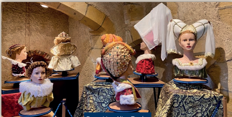
Exposition Aline Traclet